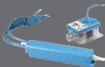
Aspen Kondensatpumpe Typ: FP3326, Mini Aqua