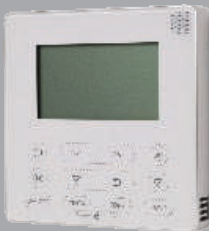
Raumregler RC100 AC