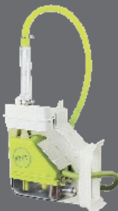
Aspen Kondensatpumpe Typ: FP3320, Mini Lime