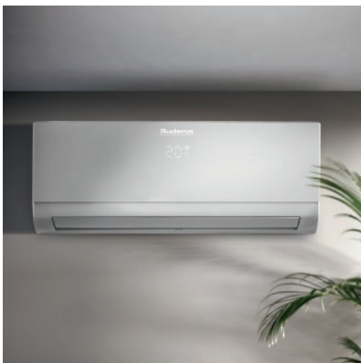
Schnell zu installieren und platzsparend: Die Inneneinheit der Logacool AC166i / AC MS sorgt für optimales Raumklima und saubere Luft.

Die Splitlösungen sind durch das geringe Gewicht leicht zu transportieren und zu installieren. Die Innen- und die Außeneinheit können durch die gut zugänglichen Anschlüsse der Rohrleitungen unkompliziert miteinander verbunden werden. Sobald das System eingebaut ist, kann das Set sofort verwendet werden, da das Kältemittel R32 mit einem GWP von nur 675 bereits in den Außeneinheiten enthalten ist. Dies gilt bis zu einer bestimmten Rohrleitungslänge je nach Typ. Außerdem stehen diverse Zubehörteile und Dienstleistungen wie z. B. die Inbetriebnahme oder der Anschluss der kältetechnischen Rohrverbindungen zur Verfügung. Sobald die Inbetriebnahme erfolgt ist, kann das Klimagerät gestartet werden.